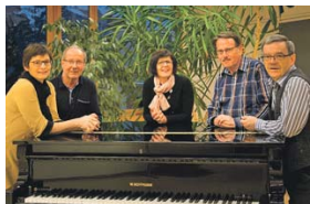
Der neue Vorstand des GVK Bendern-Gamprin.