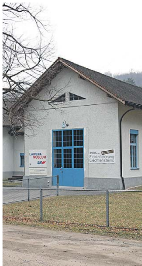
Das Lawena-Museum und das Lawena-Kraftwerk in Triesen.

TRIESEN Am Sonntag, den 25. März, von 13 bis 17 Uhr. Sonderausstellung «Elektrifizierung Liechtensteins». Neben dem Elektromuseum kann auch das Lawena-Kraftwerk besichtigt werden. Verbinden Sie den Sonntagsspaziergang mit Ihrer Familie und Freunden in erholsamer Natur mit einem Besuch im Lawena-Museum. Gruppenführungen wer-